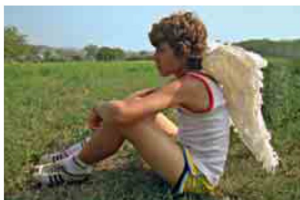
Il bambino protagonista in un momento del film

L'uomo fiammifero è stato selezionato al Giffoni festival e proiettato davanti a una folla di bambini esultanti, il 14 luglio del 2009. Dopo