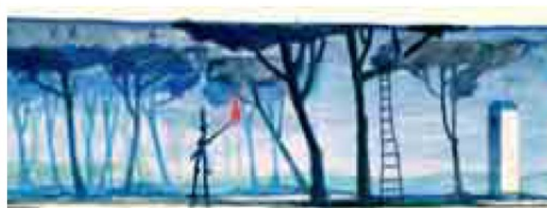
Acquerello, opera del regista